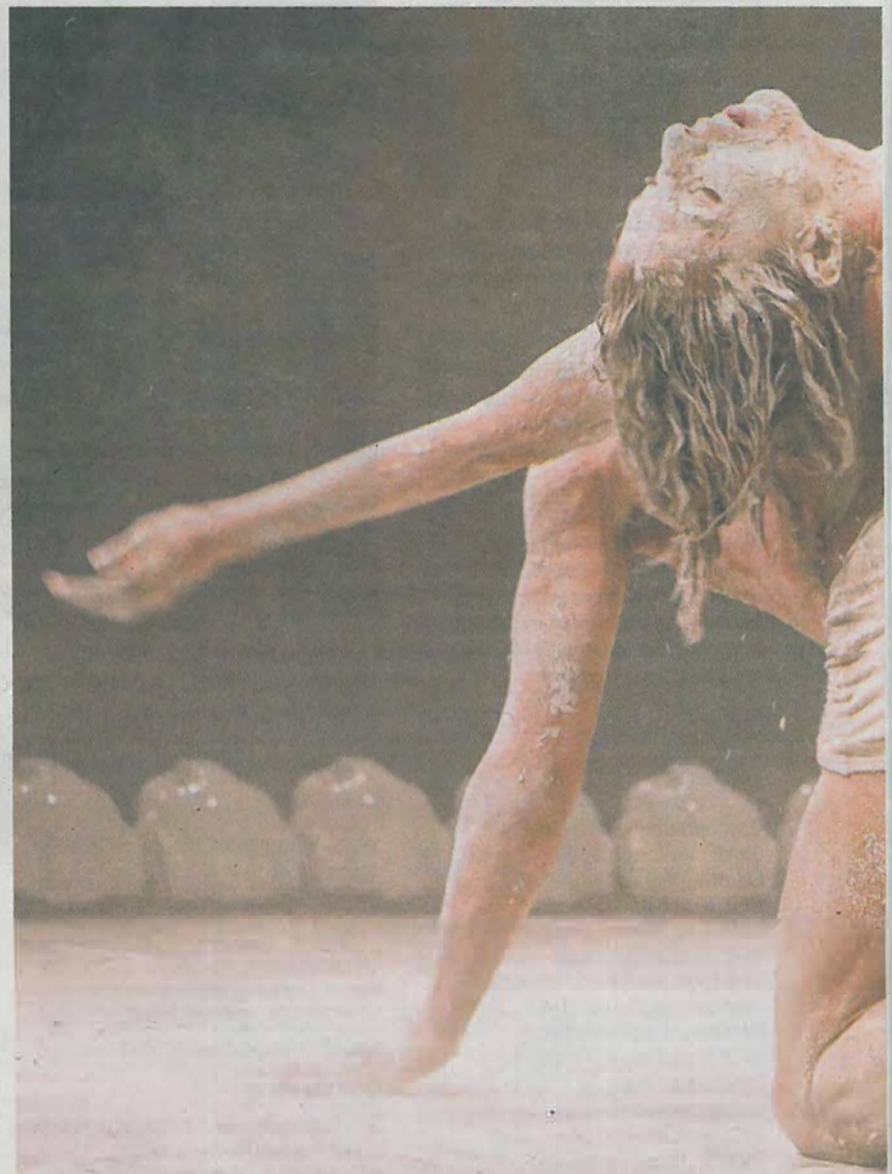
Danse et corps sculptés : « Rito » de la compagnie espagnole Otradanza,

(1) Les horaires et lieux des spectacles sont susceptibles d'être modifiés en fonction du temps. Renseignements sur les sites mimos.fr et sur Facebook.