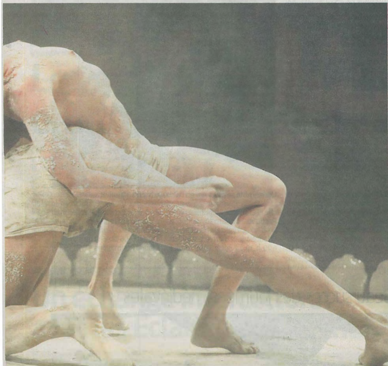
à voir au Cube Cirque à Boulazac.