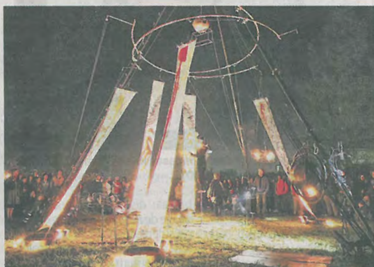
La compagnie Carabosse se produira aux Arènes.