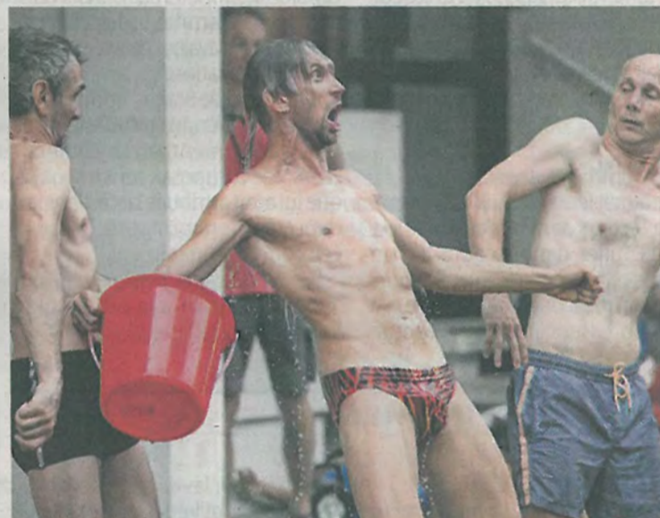
Même après la pluie, les acteurs du spectacle « Icy-Plage » sont mouillés.